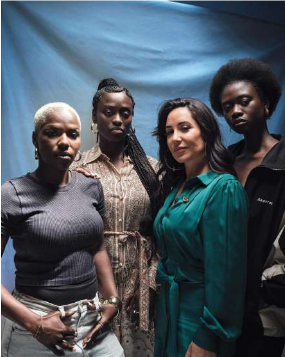
CinemaTeaser © Sébastien Vincent