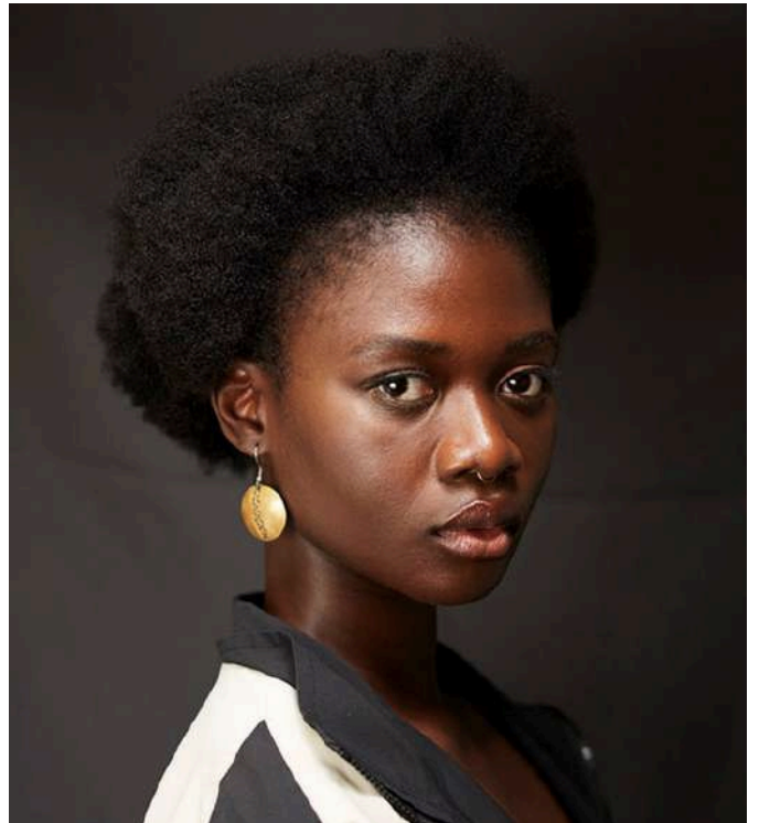
Festival de Cannes