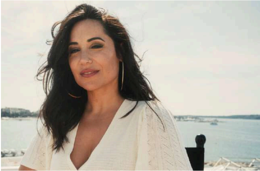
So Film © François Isnard