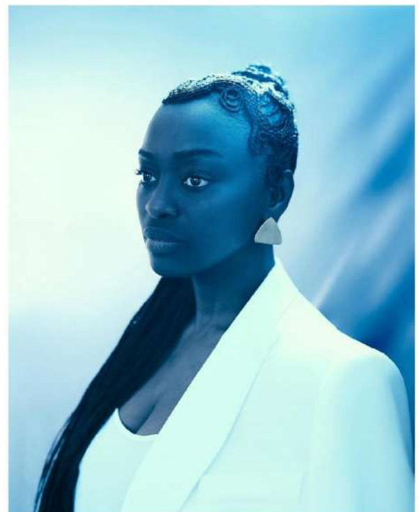
Festival de Cannes