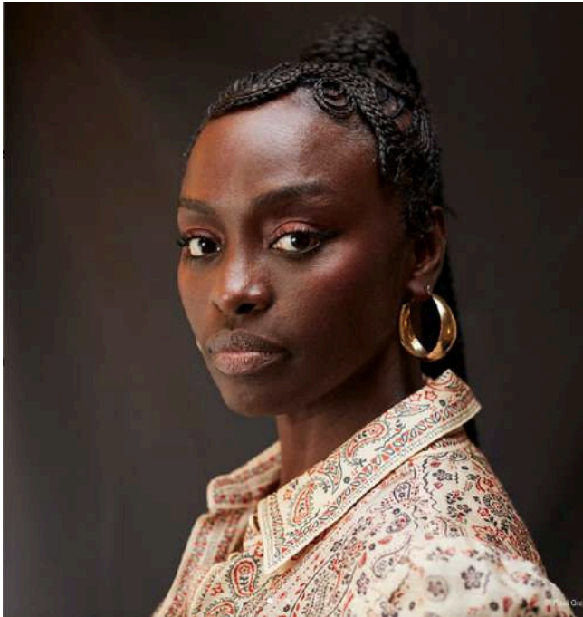
Festival de Cannes