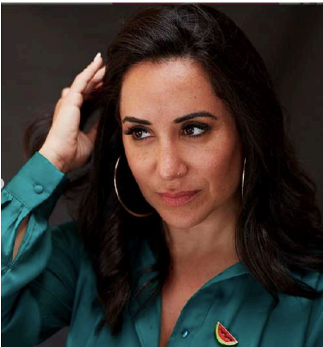
Festival de Cannes