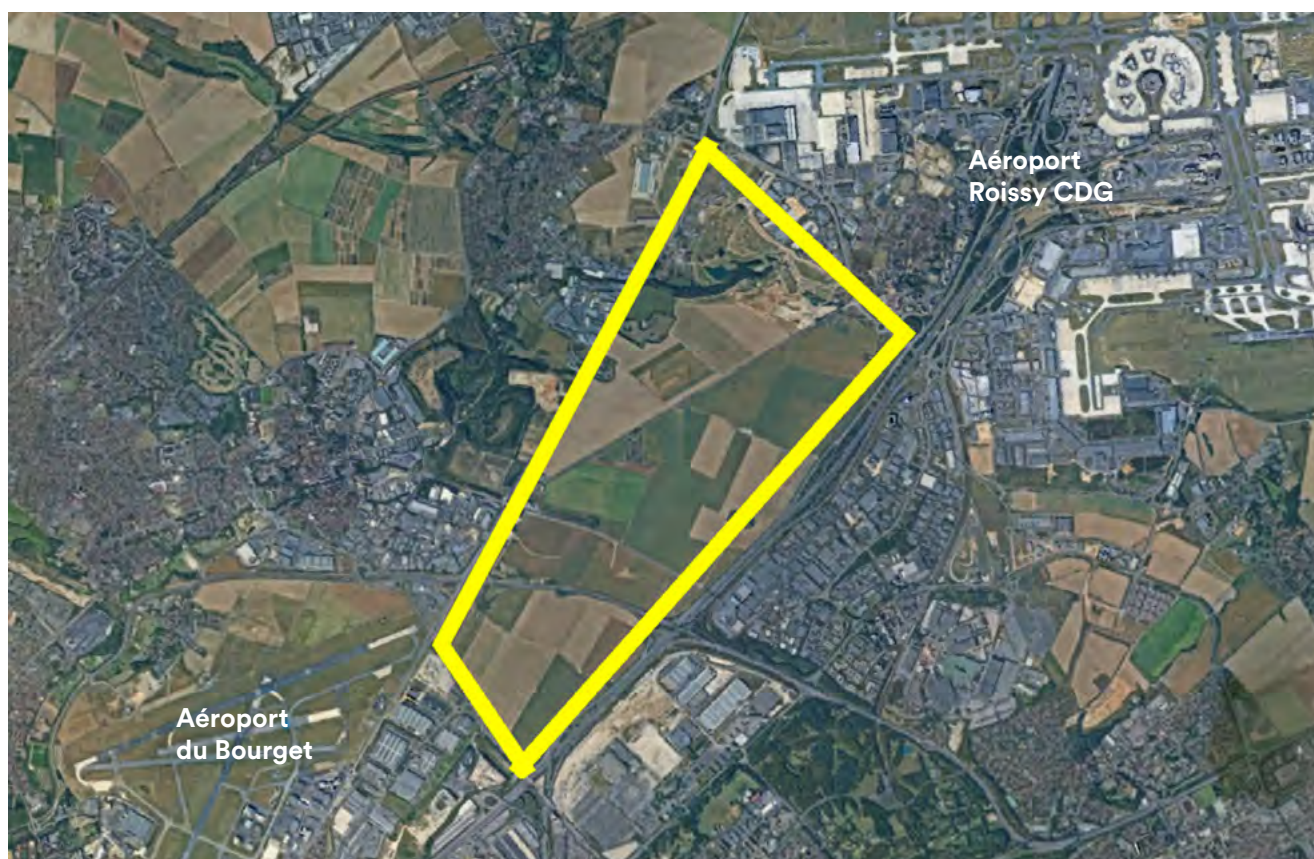
Le "triangle de Gonesse" sur la photo satellite.

Ministre de l'Écologie du gouvernement d'Edouard Philippe