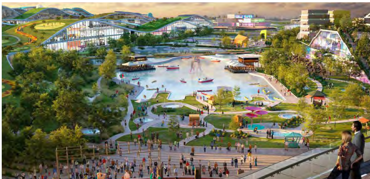
Vue d'artiste du projet EuropaCity © Alliages et territoires